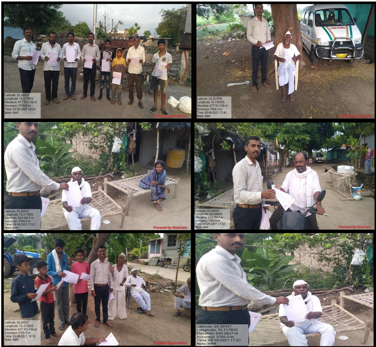
Campaign against Palas tree cutting at village Waghapur on 05/09/2021