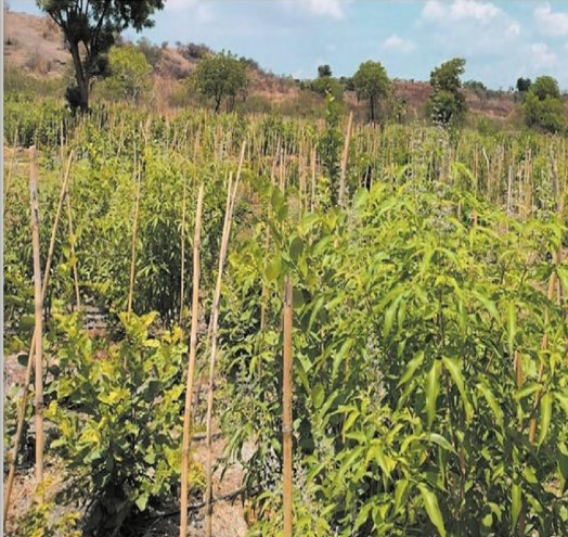
धामणगाव बडे : सिंदखेड येथे मीयावाकी प्रकल्प साकारत आहे. या प्रकल्पांतर्गत ओसाड असलेल्या एक हेक्टरवर विविध प्रकारची वृक्ष सय्या बहरले आहे. ग्रामस्थ या वृक्षांची काळजी घेत असल्याने येथे वन्यतंत्र ओसाड जमिनीवर जंगलाची निर्मिती होत आहे.

Akola Main Page No. 2 May 24, 2023 Powered by: enelego.com