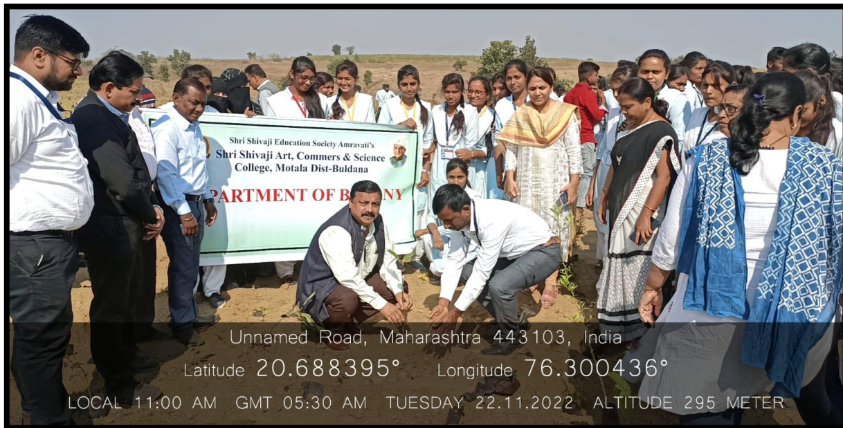
Tree plantation program for Miyawaki Forest at Jaipur (Motala) on 22 Nov. 2022