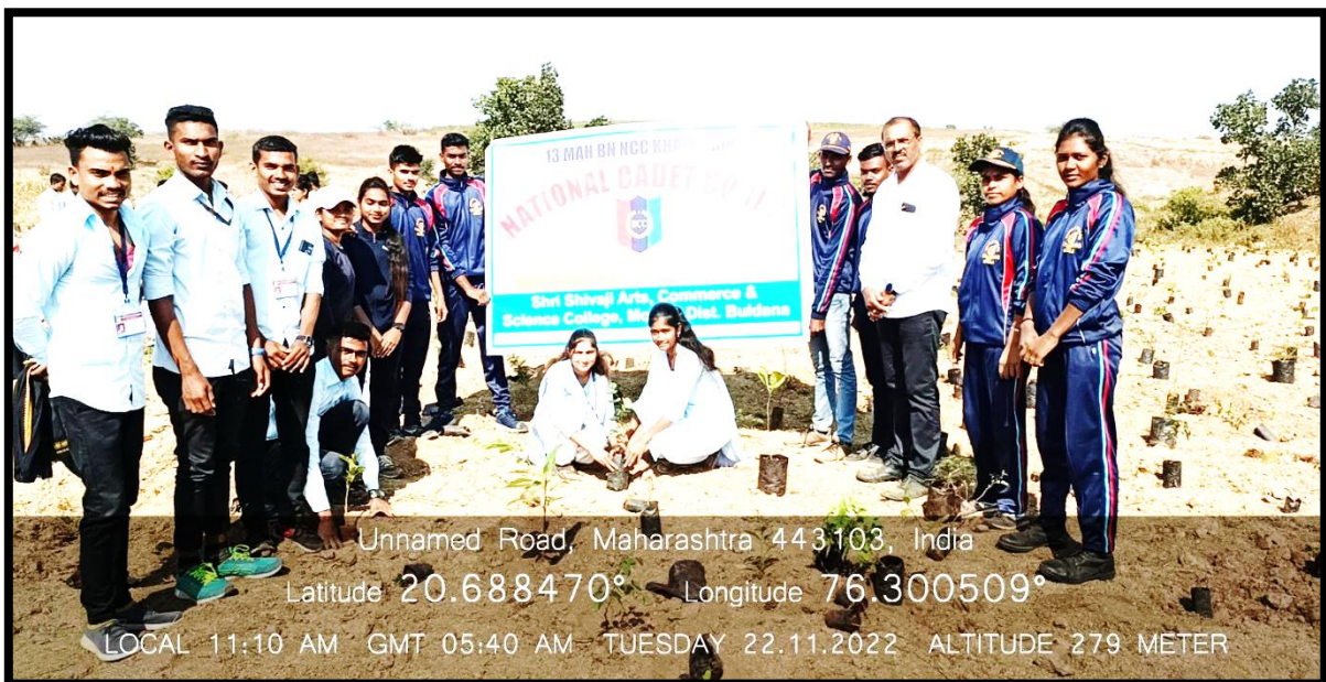
Tree plantation program for Miyawaki Forest at Jaipur (Motala) on 22 Nov. 2022