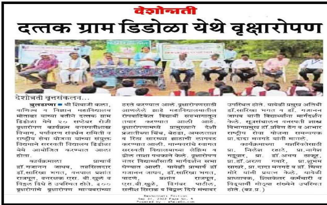
Newspaper Cutting: Tree Plantation at Didola Bk.