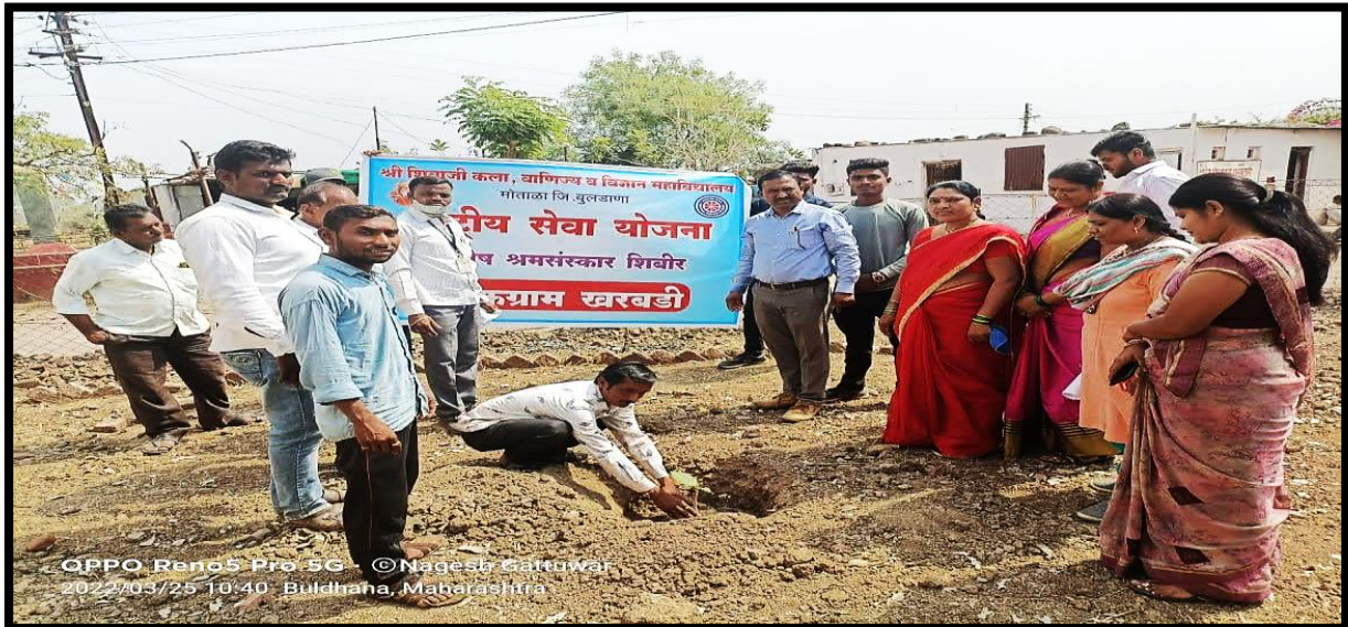
Tree plantation drive at NSS adopted village Kharbadi on dated 25/03/22

A tree plantation program was organized at NSS adopted village of Kharbadi on 25 March 2023. The department of NSS conducted this tree plantation drive during “Shramsanskar Shibir”.