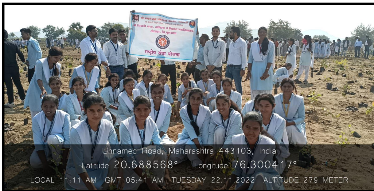
NSS Volunteers Participate in Tree Plantation at Jaipur on 22 Nov. 2022

Action Taken Report: In response to the appeal of Paani Foundation, our students and staff rises helping hand for the construction of Miyawaki Forest at Sindkhed (Praja) and Jaipur. Students and staff first help to distributed the plants in marked places created by volunteers of Paani Foundation and SayTrees. After distribution, we start the cultivation by making pits and cultivated about 9000 plants in respective villages.