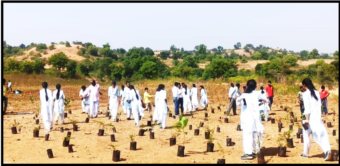
Students distributed plants by making chains and planting trees on 16 November 2022