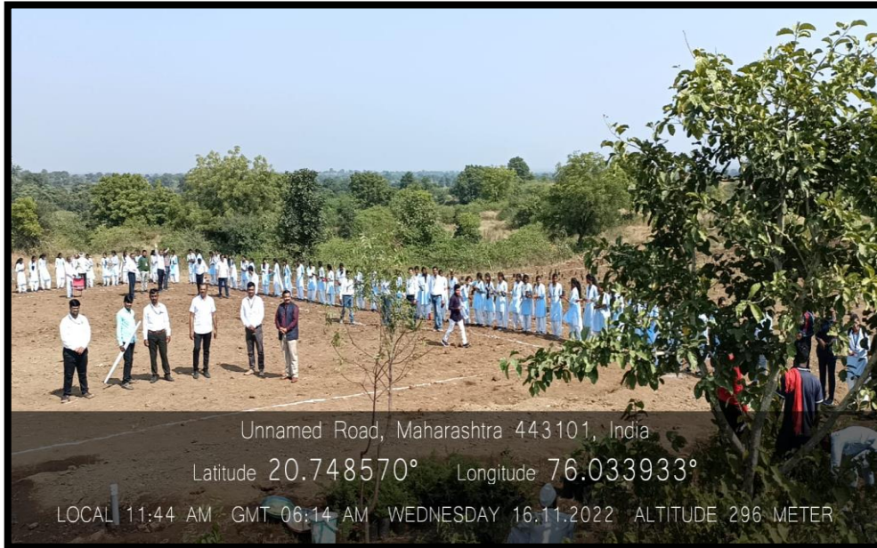
Tree plantation program for Miyawaki Forest at Sindkhed (Praja) on 16 Nov. 2022