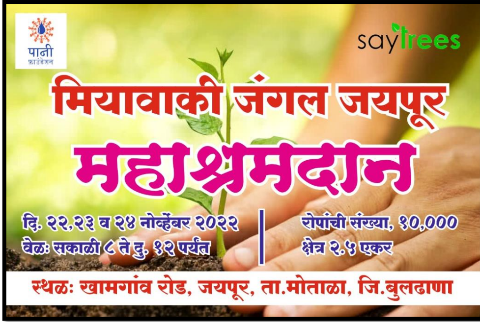
Leaflet of Miyawaki Forest “Mhashramadan”