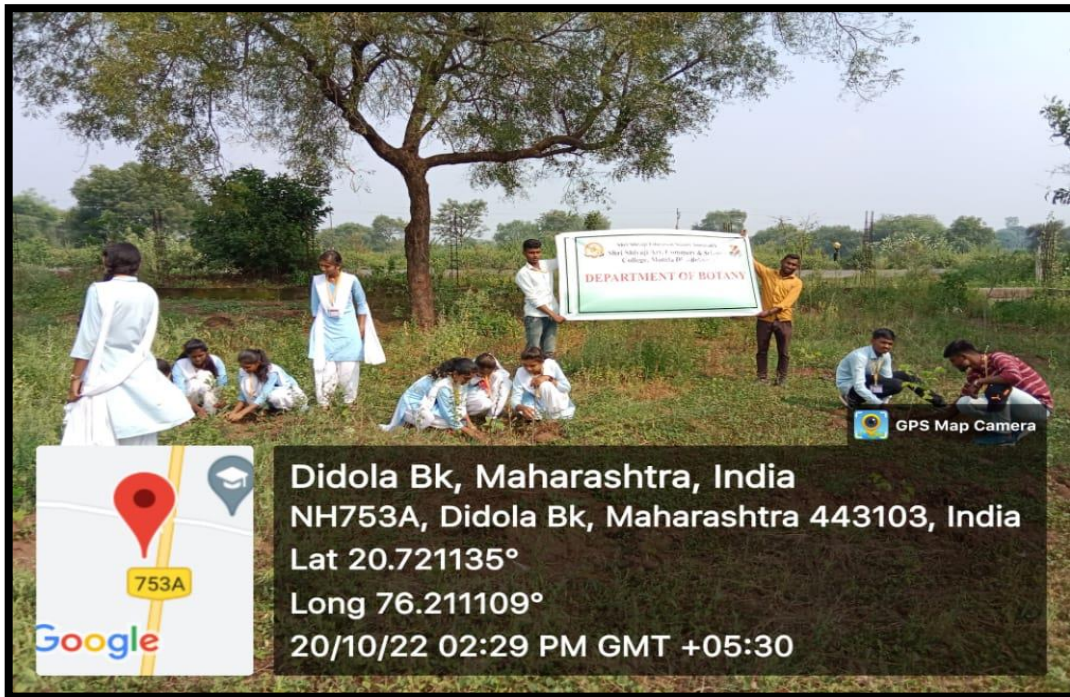
Students Eradicating weeds near plants at adopted village Didola BK on 20/11/2022