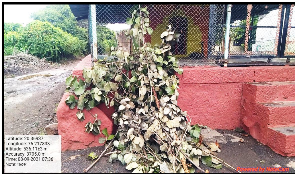
Wastage of large branches offer to god Hanuman on dated 08/09/2021