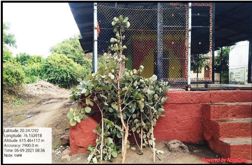
Large Branches Offer to God Hanuman on Dated 06/09/2021