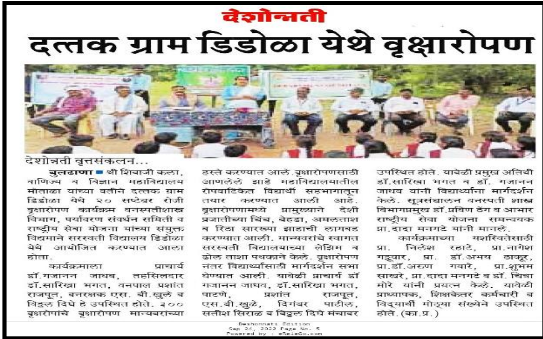
Newspaper Cutting: Tree Plantation at Didola Bk.