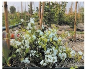
ओसाड जमिनीवर फुलझाडेही बहरली आहेत.

नवीन मोडे लोकमत न्यूज नेटवर्क धामणगाव बडे : भोताळा तातुसपारील सिंदखेड येथील ओसाड माळरानावर मीयावाकी संकल्पनेनुसार सिंदखेड येथील सर्वोत्तम मोठ्या घनदाट जंगल निर्मितीस नेह्येवर २०२१ मध्ये मार्ग झाला होता. सुमारे सहा महिन्यांनंतर या प्रकल्पाचे सकारात्मक परिणाम समोर आले असून सिंदखेड येथील ओसाड असलेल्या सुमारे एक हेक्टर क्षेत्रात विविध प्रकारची हिरीरीत झाडे डोसत आहेत.