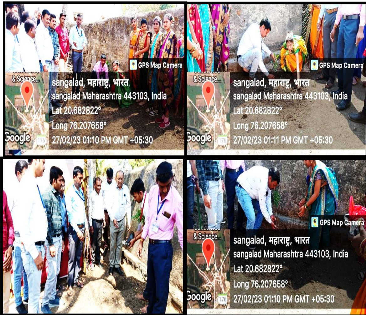
Tree Plantation Plantation at Sangalad on 27 February 2023