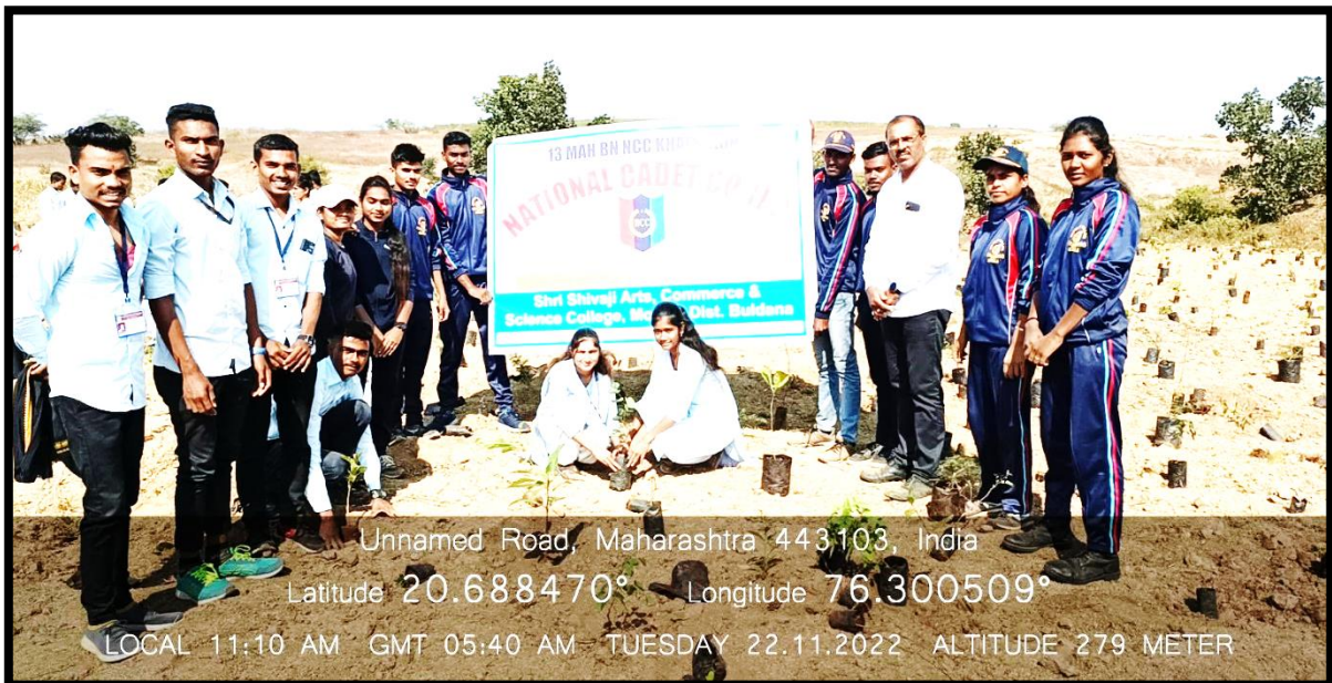
Tree plantation program for Miyawaki Forest at Jaipur (Motala) on 22 Nov. 2022