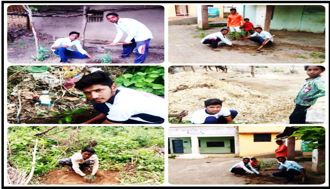
Students Planted trees at home and in the nearby area on 5 June 2020