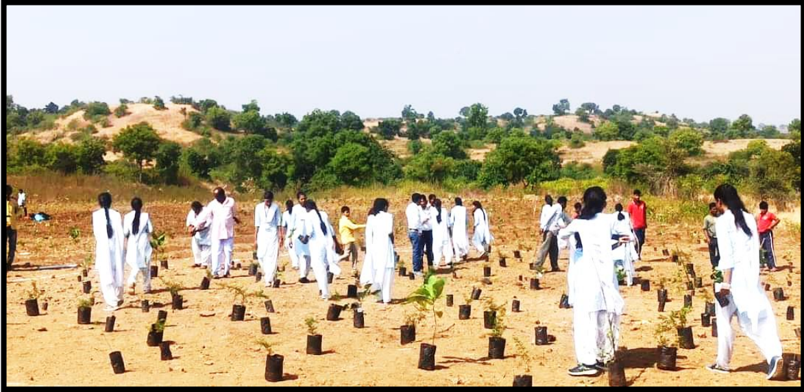
Students distributed plants by making chains and planting trees on 16 November 2022