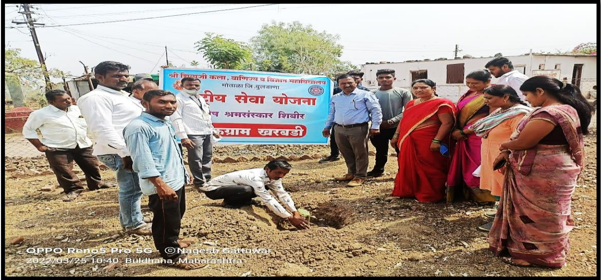
Tree plantation drive at NSS adopted village Kharbadi on dated 25/03/22

A tree plantation program was organized at NSS adopted village of Kharbadi on 25 March 2023. The department of NSS conducted this tree plantation drive during “Shramsanskar Shibir”.