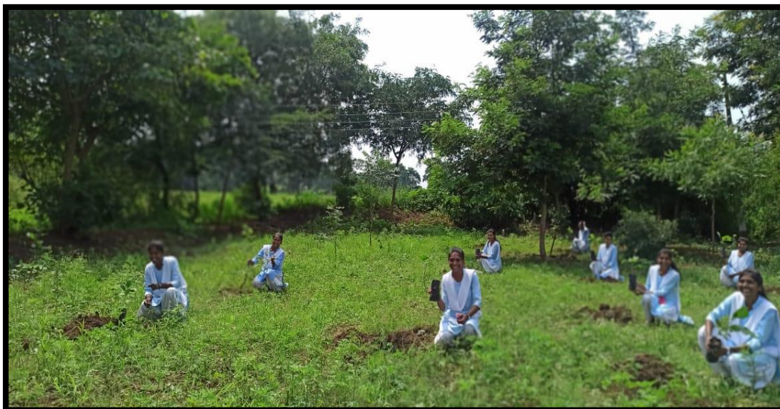
Tree Plantation Drive at Adopted Village Didola BK on dated 20/09/2022