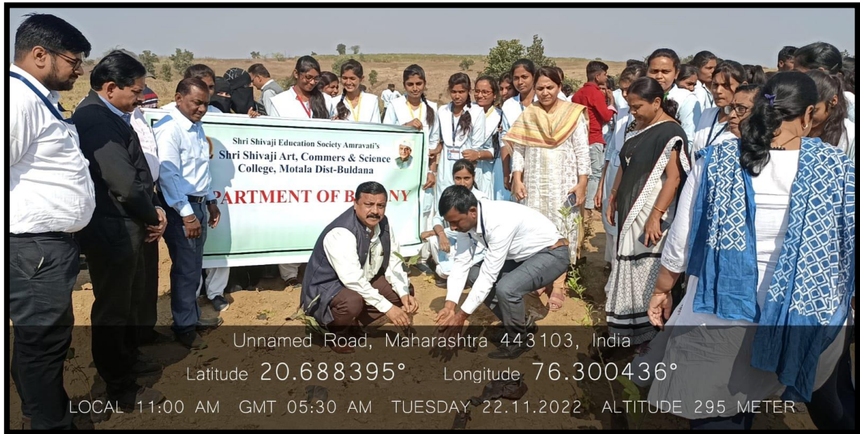
Tree plantation program for Miyawaki Forest at Jaipur (Motala) on 22 Nov. 2022