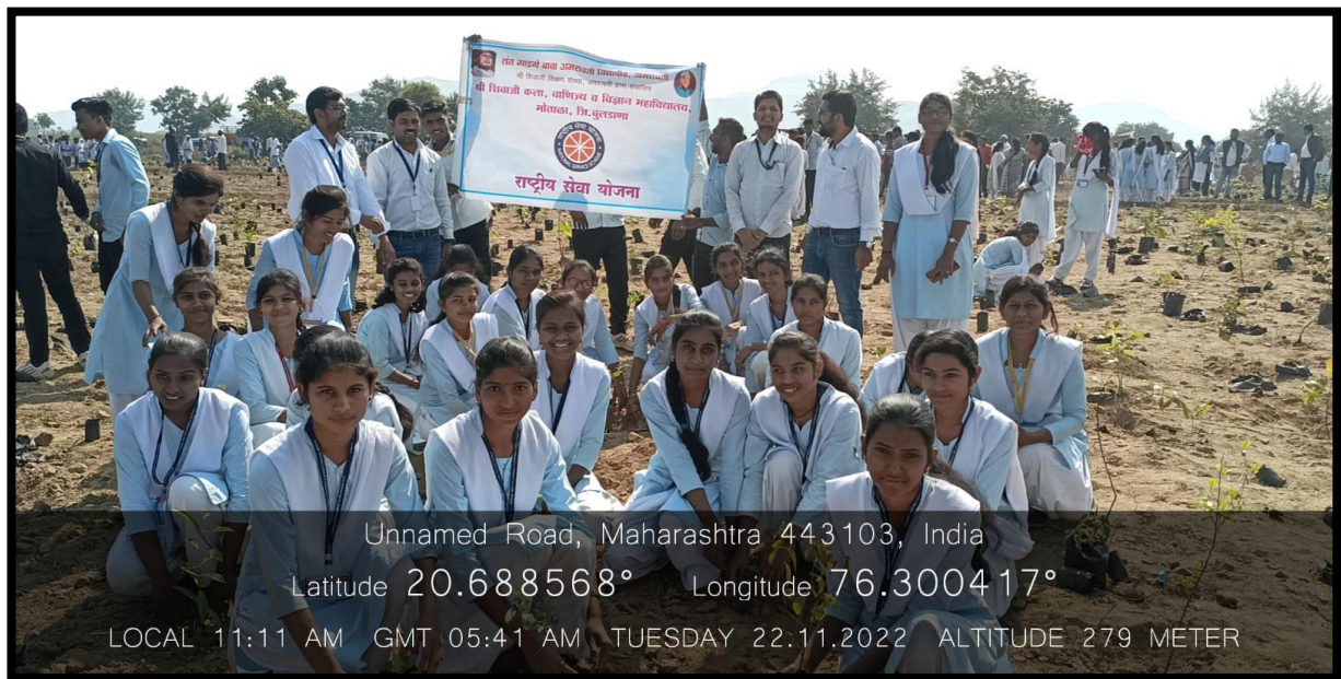
NSS Volunteers Participate in Tree Plantation at Jaipur on 22 Nov. 2022