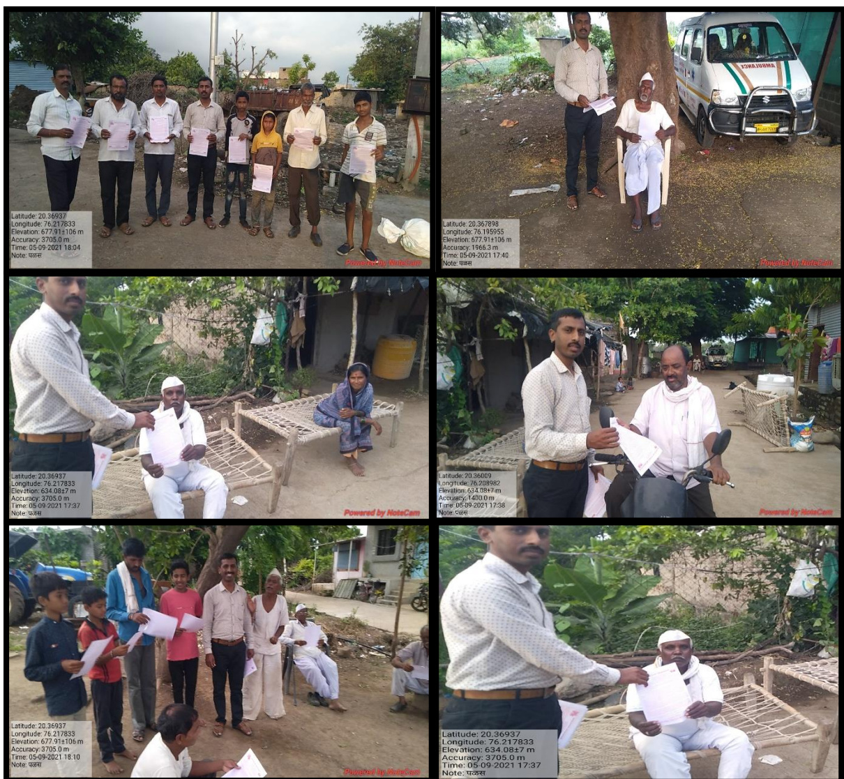
Campaign against Palas tree cutting at village Waghapur on 05/09/2021

Department of Botany in collaboration with the nature club conducted a campaign against the cutting of palas trees on the occasion of the “Pola” festival at village Waghapur for the last two years. Tree cutting is a practice done from ancient times. Our college conducted a campaign against it for the last three years and aware people of this bad practice. After the campaign tree cutting reduces by about 90-95% by creating awareness against this Malpractice.