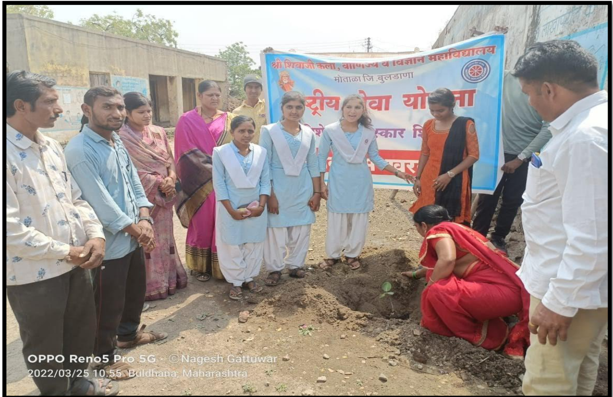
Tree plantation drive at NSS adopted village Kharbadi on dated 25/03/02