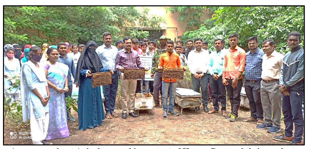
Awareness about Apiculture and important of Honey, Bees and their product