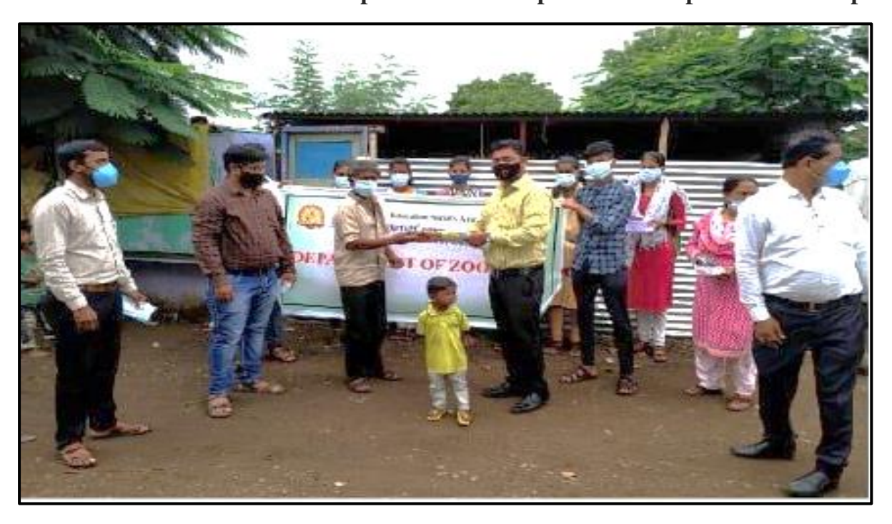
Mask and Sanitizer distribution to local people during Covid 19 pandemic period