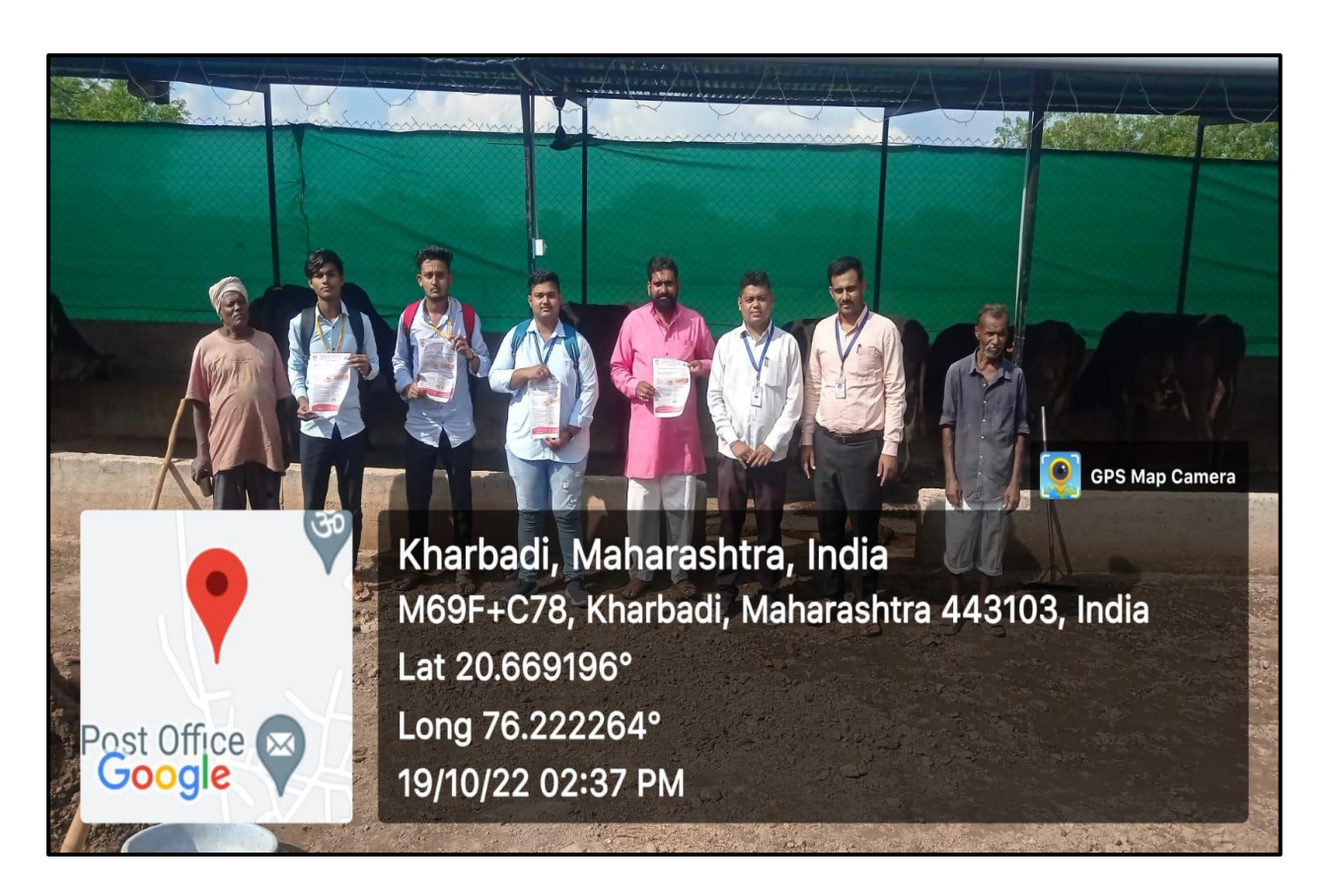
Lumpy Disease Awareness Program