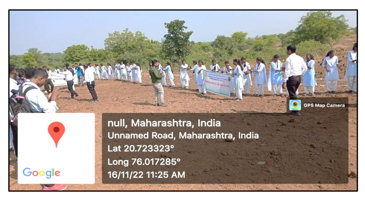
Students and Teacher of the department Participation in tree plantation Camp