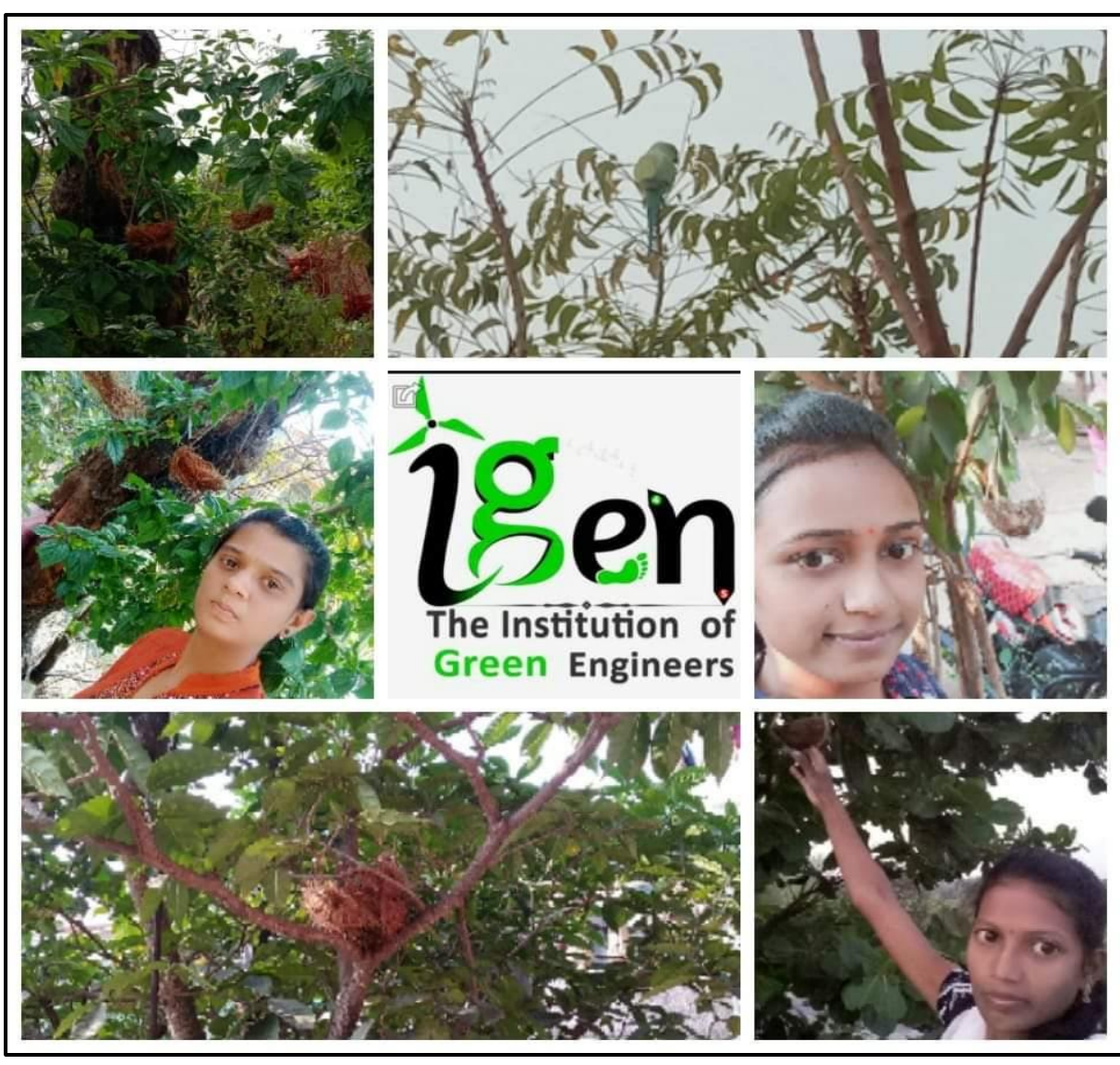
Participations in 99 days Online Project of IGEN (Institutes of Green Engineers) for Awareness and Social responsibility in Society about environment