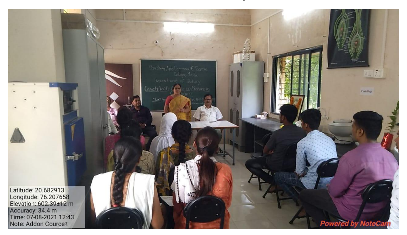
Certificate course in mushroom Cultivation Program (Certificate Distribution)

15) Certificate course in mushroom Cultivation Program (Certificate Distribution)