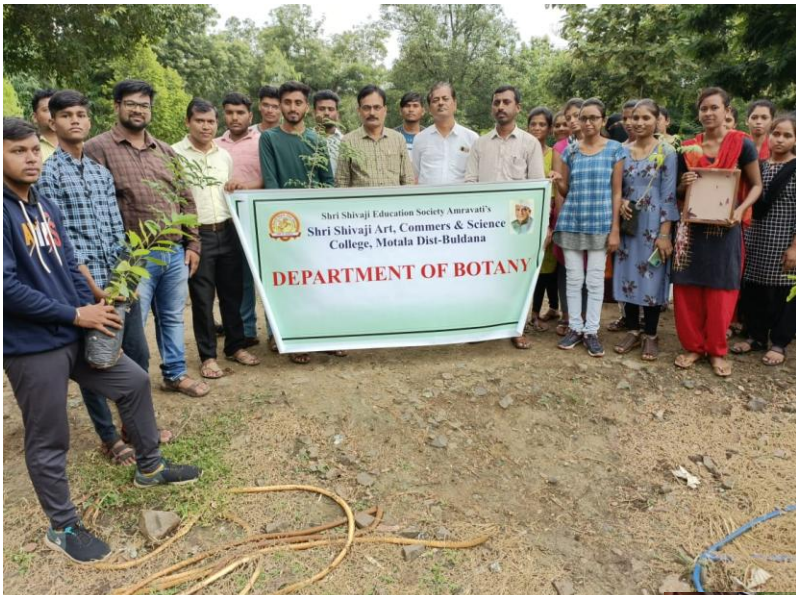
Visit to Nursery Social Forestry Department Division Motala for gaining knowledge about Nursery management and Plants.

Visit to Nalaganga Project for Study of aquatic plants.