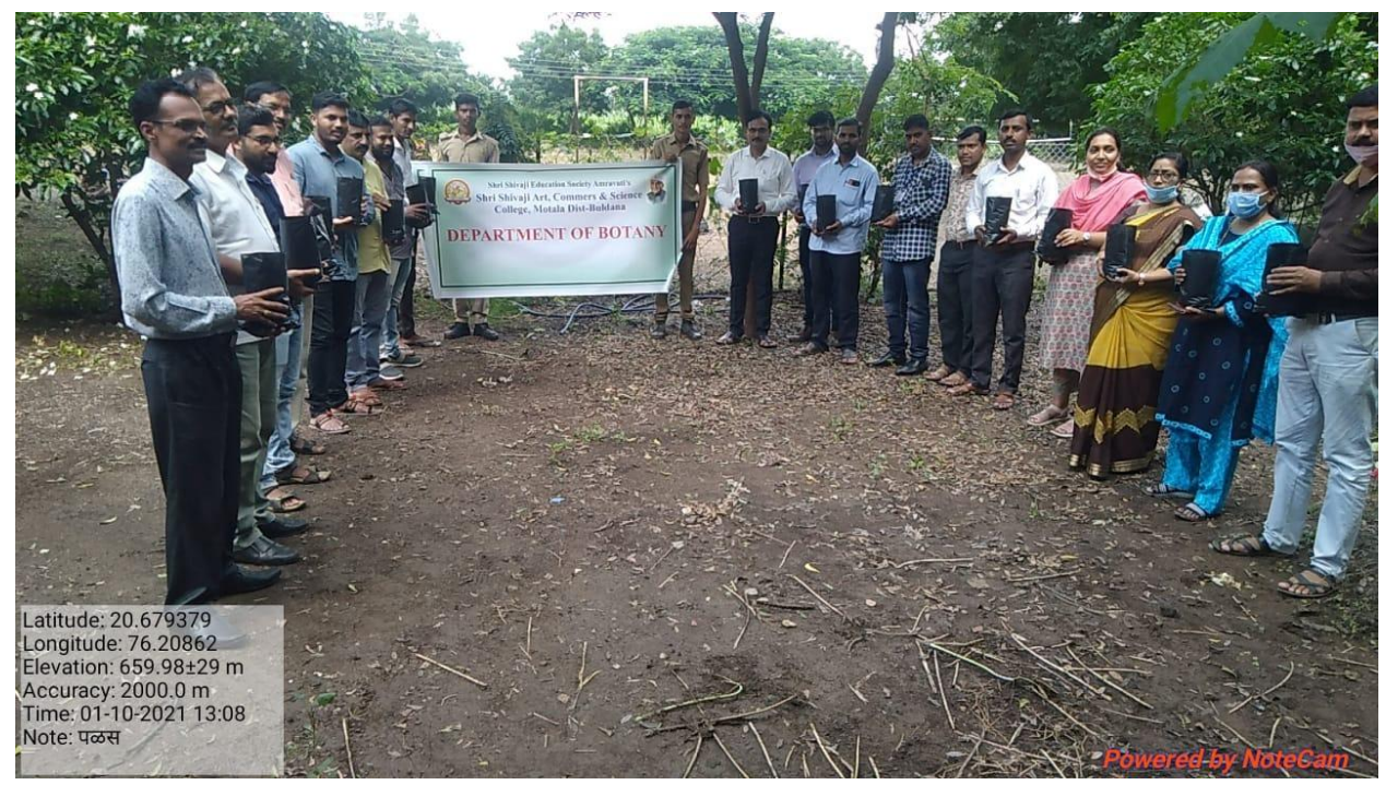
Inauguration of Nursery on 01/10/2021