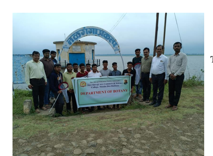
12) Botanical Excursion Tour

Six faculty members from Department of Zoology and Botany along with 10 students have completed "IGEN-SDG-9 Online 99 Days Project of Chennai IGEN Institute from 15^{th} October to 24^{th} January 2021.