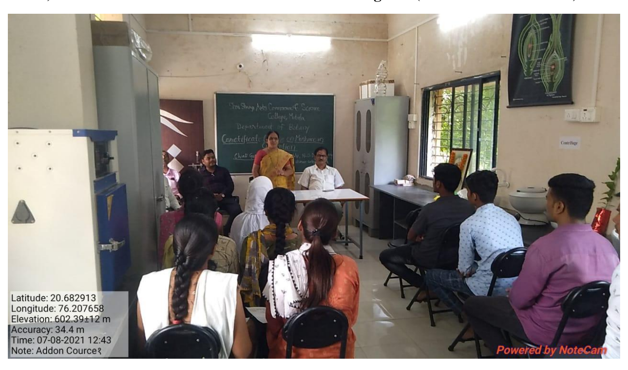
Certificate course in mushroom Cultivation Program (Certificate Distribution)