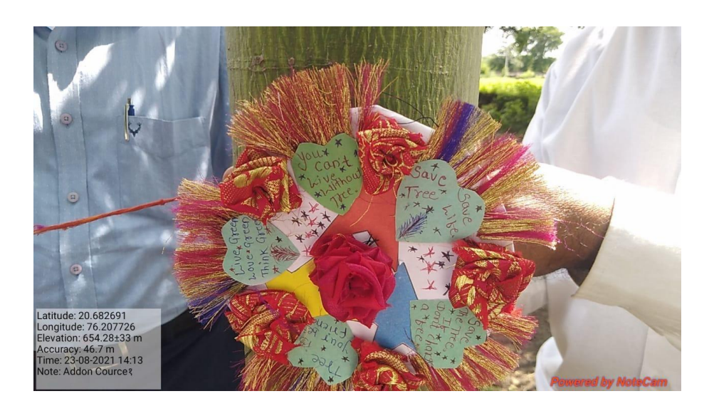
14) Inauguration of Nursery on 01/10/2021