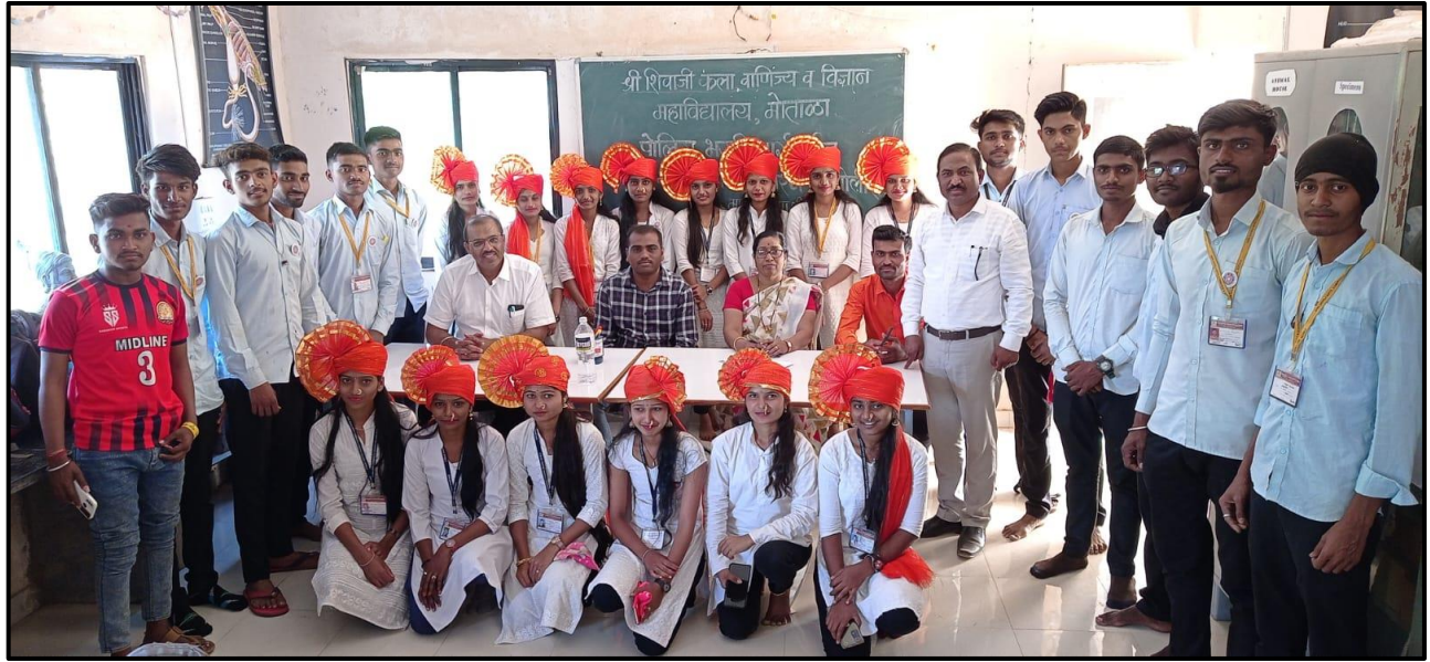
Group Photo with guest speaker